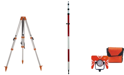
7UtsRGH GH DOXPLQVLYQ SDUD SURVPD